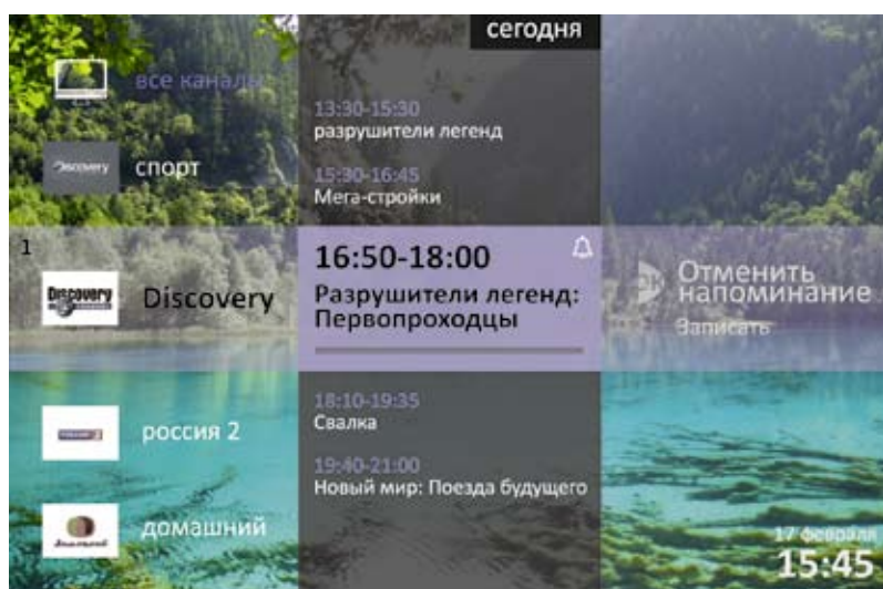
Рис. 3. Интерфейс Netris iVision Pure

Рассмотрим подробнее каждый компонент. Система транскодирования решает две основные задачи: преобразование формата входящего потока для вещания в сеть, на-