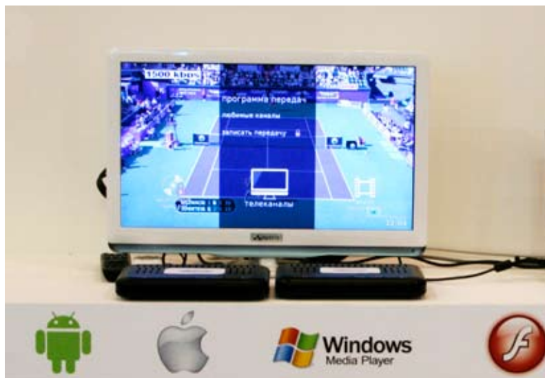
Рис. 4. Демонстрация динамической адаптации на выставке CSTB-2011. Текущая скорость вещания видеопотока - 1500 Кб/с

Непосредственное предоставление услуг OTT конечным пользователям осуществляется двумя группами видеосерверов iStream. За вещание каналов отвечает кластер серверов iStream Live TV Server, а за услуги по запросу несут ответственность серверы iStream VoD Server. Сервисы предоставляются на широком спектре пользовательских устройств: приставки, компьютеры, планшеты, мобильные телефоны. Помимо вещания каналов и видео по запросу (VoD), провайдер услуг сможет предложить своим пользователям услуги отложенного просмотра (Replay TV), виртуального видеомagneфона (nPVR) и загрузки контента на жесткий диск абонентского устройства (Push VoD + DVR). Единая платформа серверов iStream позволяет одновременно предоставлять услуги IPTV и OTT.