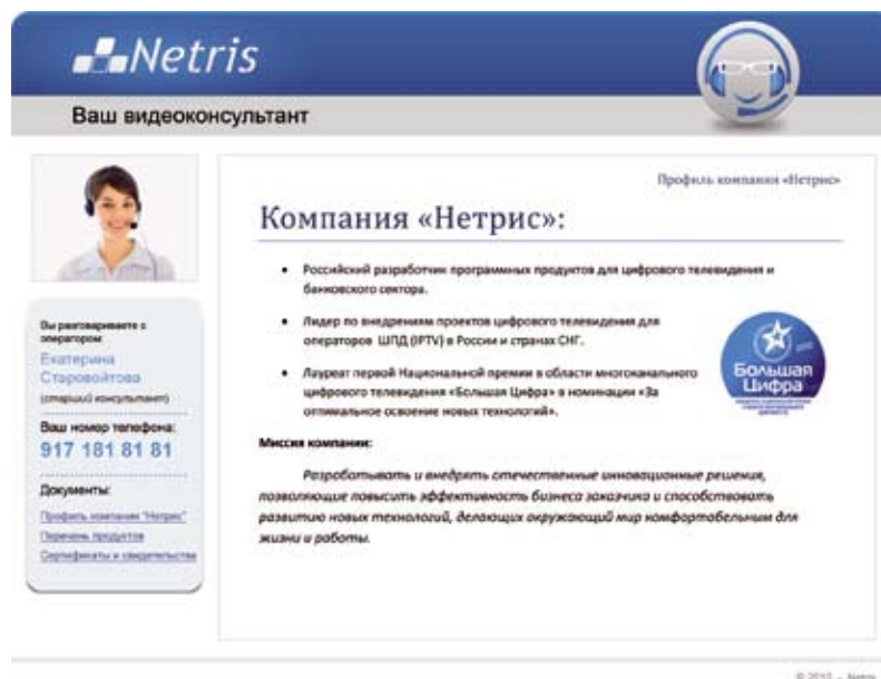
Рис. 5. Интерфейс конечного пользователя услуги «Видеоконсультант»

На выставке CSTB на своем стенде компания «Нетрис» продемонстрировала интернет-вещание с динамической системой адаптации потока на приставках (рис. 4), мобильных телефонах и, конечно, планшете iPad. На компьютере OTT было доступно в рамках трех сервисов: вещание каналов, видео по запросу и видеонаблюдение — камера была установлена в нашем московском офисе.